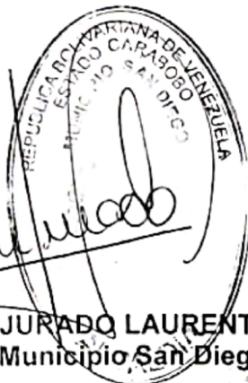
ABG. LEÓN JURADO LAURENTÍN Alcalde del Municipio San Diego